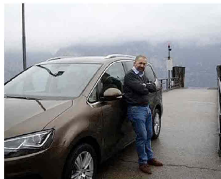
Nuova Seat Alhambra 2.0 TDI 240 CV: soprattutto comoda

I tre momenti di Eco Targa Florio che coinvolgono le vetture in una gara di regolarità hanno diversi criteri di selezione per l'iscrizione delle auto.